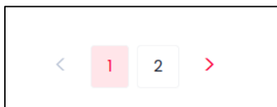
Figure 7 - Actualités, numéro de page a un contraste insuffisant par rapport à son fond

Sur le composant de pagination, le numéro de page en cours avec la couleur du fond rouge #fce8e9 et la couleur du numéro rouge #e03136 produisent un contraste insuffisant de 3.83:1.