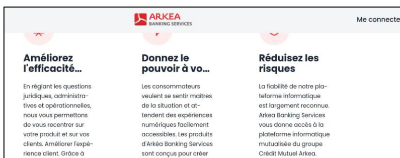
Figure 9 - Nos offre, titres tronqués avec un zoom à 200%

Critère 10.5 Dans chaque page web, les déclarations CSS de couleurs de fond d'élément et de police sont-elles correctement utilisées ?