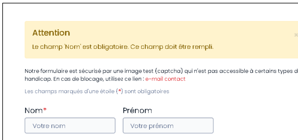
Figure 12 - Nous contacter, mauvaise gestion des messages d'erreurs.