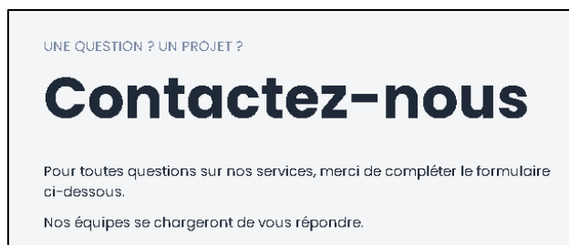
Figure 4 - Nous contacter, une question contraste insuffisant entre le texte et son arrière-plan