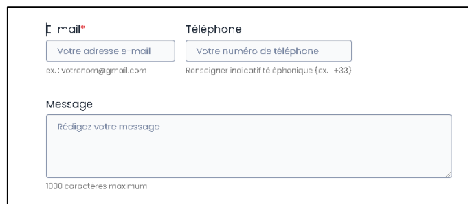
Figure 11 - Nous contacter, étiquette pas assez explicite, manque aide à la saisie