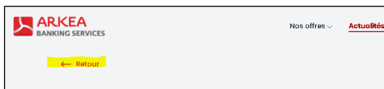
Figure 3 - Lien retour, contraste insuffisant entre le texte et son arrière-plan

Dans les en-têtes de pages qui contiennent un lien de retour, celui-ci a un ratio de contraste insuffisant. Le contraste entre le texte rouge (#e03136) et le fond gris clair (#f3f4f6) est de 4.09:1.